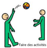
Faire des activités

Faire des activités Être gentil / gentille Lui demander de l'aide L'aider Partager Accepter ses idées Lui dire ce que je pense Avoir du plaisir