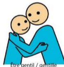
Être gentil / gentille