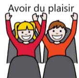
Avoir du plaisir