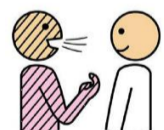
Lui dire ce que je pense