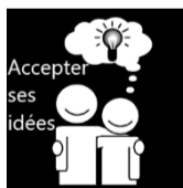
Accepter ses idées